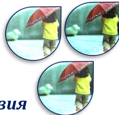
Схема межведомственного взаимодействия